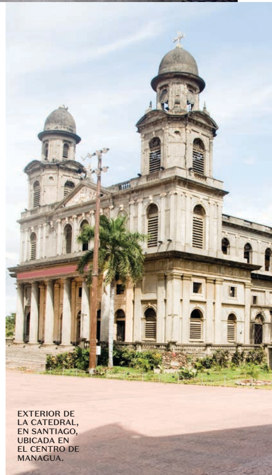
EXTERIOR DE LA CATEDRAL, EN SANTIAGO, UBICADA EN EL CENTRO DE MANAGUA.

Izda.: aspecto de las instalaciones de Nekupe, Sporting Resort and Retreat, en Nandaime; arriba: interior de la master suite , en Meson Nadi.